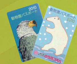
絵本作家のあべ弘士さんによるイラストがデザインされています