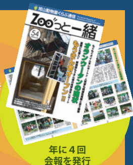
年に4回 会報を発行